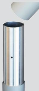
Steckstoß Z75, Z90, 2-teilig

5 Jahre Garantie auf Standicherheit der Mastrohre